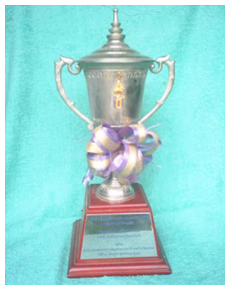
ถ้วยรางวัลพระราชทานจากสมเด็จพระเทพรัตนราชสุดาฯ สยามบรมราชกุมารี ได้รับรางวัลชนะเลิศการประกวดดนตรีพื้นบ้าน (โนรา)