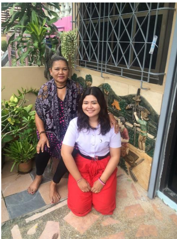
ภาพนักศึกษาจากสาขานาฏยรังสรรค์แขนงโนราห์รับการถ่ายทอดการร้องบทโนราห์ จากโนราละมัยศิลป์ ณ บ้านพักที่หาดใหญ่