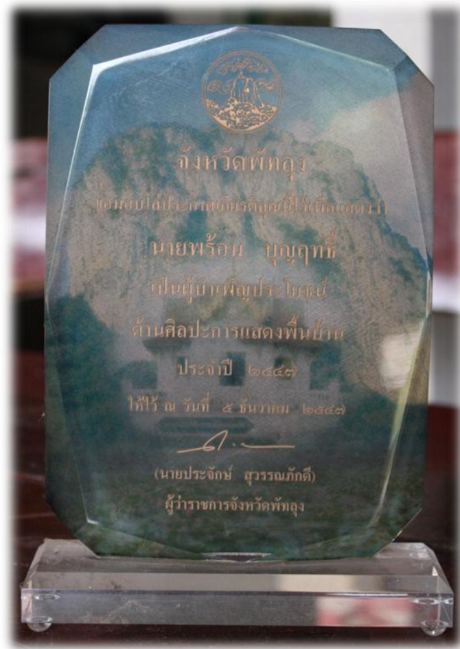
โล่ประกาศเกียรติคุณ ผู้นำเพื่อประชาชนด้านศิลปปะการแสดงพื้นบ้าน จังหวัดพัทลุง