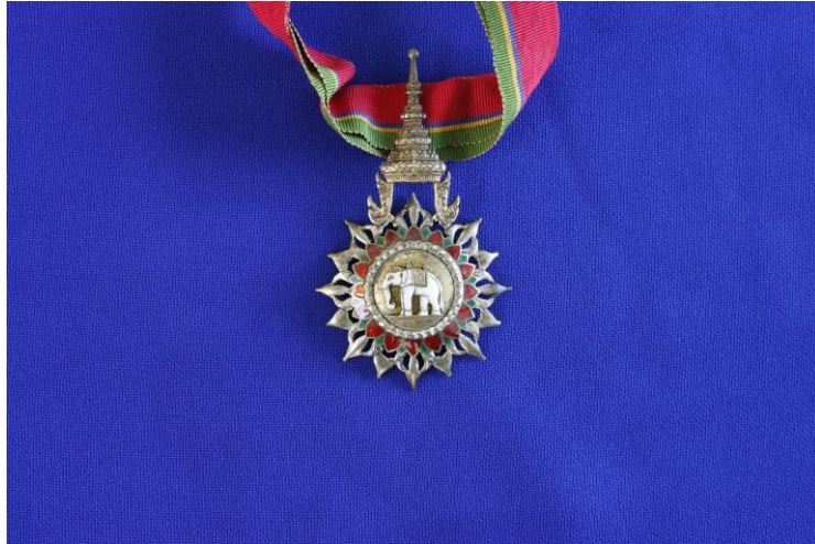
เครื่องราชอิสริยาภรณ์ช้างเผือก ชั้นที่ 3 เมื่อ พ.ศ. 2524