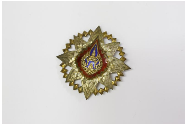
เครื่องราชอิสริยาภรณ์มงกุฎไทย