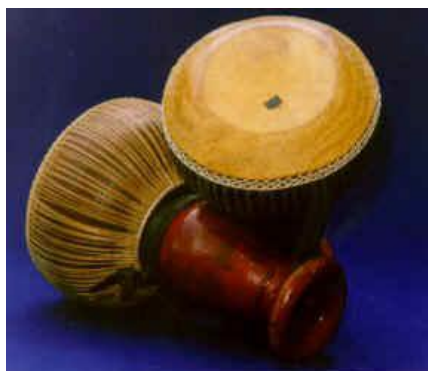
ภาพประกอบ : ตัวอย่างเครื่องดนตรีทับ

นักดนตรีที่สามารถตีทับได้ครบทั้ง 12 เพลง เรียกกันว่า "มือทับ" เป็นคำยกย่องว่าเป็นคนเล่นทับมือฉมังทับหนังตะลุงมี 2 ใบ ใบหนึ่งเสียงเล็กแหลม เรียกว่า "หน่วยฉับ" / อีกใบหนึ่งเสียงทุ้ม เรียกว่า "หน่วยเทิง" ทับหน่วยฉับเป็นตัวยี่น ทับหน่วยเทิงเป็นตัวเสริม หนังตะลุงในสมัยโบราณมีมือทับ 2 คน ต่อมา เมื่อประมาณ 60 ปีมาแล้ว หนังตะลุงใช้มือทับเพียงคนเดียวโดยใช้ผ้าผูกทับไขว้กัน เวลาเล่นบางคนวางทับไว้บนขา บางคนก็พาดขาตทับเอาไว้ไม่ให้เคลื่อนที่