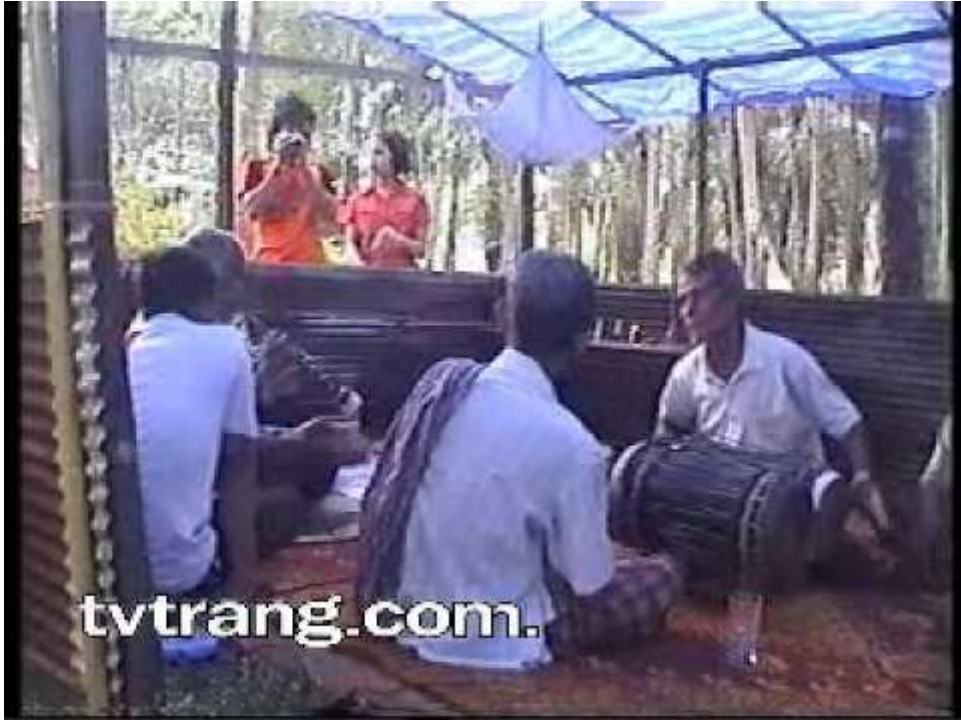
ภาพประกอบ : ตัวอย่างการเล่นดนตรีกาหลอ