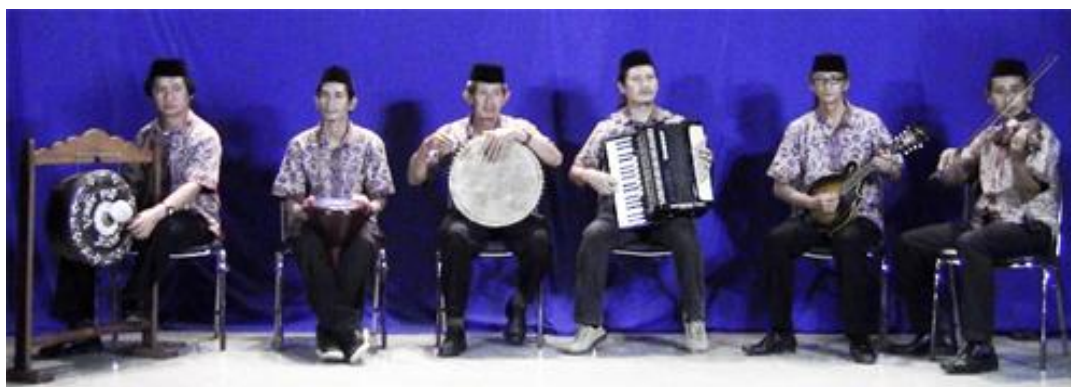
ภาพประกอบ : คณะนักดนตรีร้องเง็ง