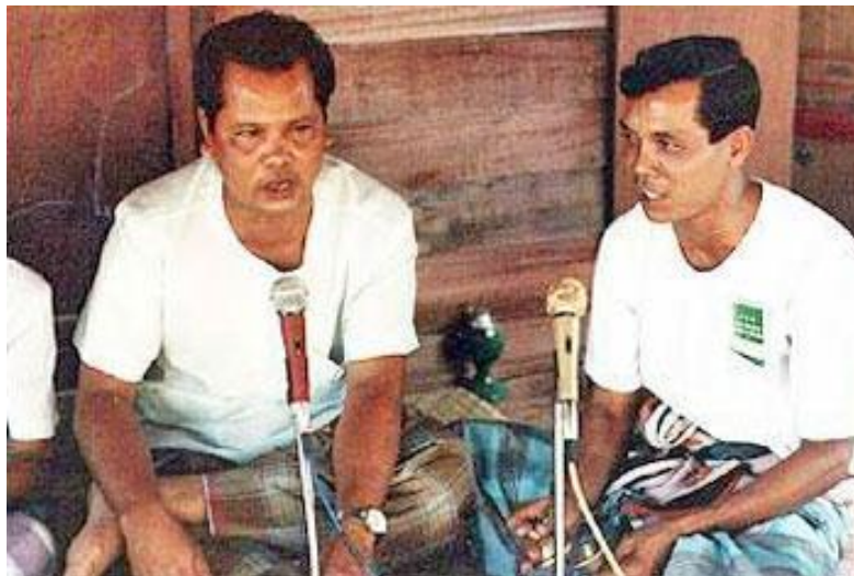
ภาพประกอบ : ตัวอย่างการร้องเพลงบอก

สำหรับวิธีการขับเพลงบอก เมื่อแม่เพลงร้องจบวรรคแรกลูกคู่ก็รับครั้งหนึ่งโดยรับว่า "ว่าเฮ้ว่าเห" พร้อม ๆ ก็จะต้องคอยตีฉิ่งให้เข้ากับจังหวะ ถ้าหากแม่เพลงว่าวรรคแรกซ้ำอีกลูกคู่ก็จะรับว่า "ว่าทอยซ้ำฉ่าเหอ" และเมื่อแม่เพลงว่าไปจนจบบทแล้ว ลูกคู่จะต้องรับวรรคสุดท้ายอีกครั้งหนึ่ง