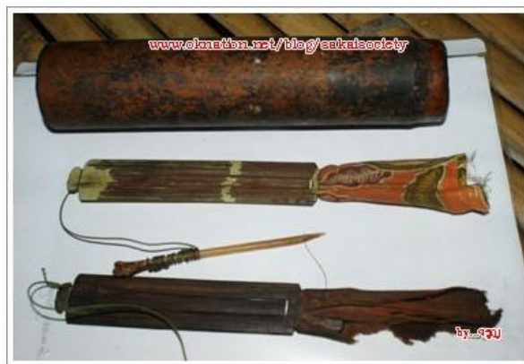
ภาพประกอบ : ตัวอย่างเครื่องดนตรีของชนพื้นเมืองซาไก

ชนในกลุ่มของภาคใต้ของไทย มีหลายเผ่าพันธุ์และมีหลายกลุ่ม ในอดีตมีการติดต่อค้าขาย มีความสัมพันธ์กับอินเดีย จีน ชวา - มลายู ตลอดจนถึงติดต่อกับคนไทยในภาคกลาง ที่เดินทางไปค้าขาย ติดต่อกันด้วย ในชนบทความเจริญยังเข้าไปไม่ถึง ลักษณะของ ดนตรีพื้นบ้าน จึงเป็นลักษณะเรียบง่าย ประดิษฐ์อย่างง่าย ๆ จากวัสดุใกล้ตัวมีการรักษาเอกลักษณ์ และยอมให้มีการพัฒนาได้น้อยมาก (ดนตรีพื้นบ้านดั้งเดิม เทียบเคียงได้คล้ายคลึงกับเผ่าพันธุ์ เงาะซาไก) ประเภทเครื่องตี โดยใช้ไม้ไผ่ลำขนาดต่าง ๆ กัน ตัดออกเป็นท่อน สั้นบ้างยาวบ้าง ตัดปากของกระบอกไม้ไผ่ ตรงหรือเฉียง บ้างก็หุ้มด้วยใบไม้ กาบของต้นพีช ใช้บรรเลง (ตี) ประกอบการขับร้องและเต้นรำ เครื่องดนตรี ค่อย ๆ พัฒนามาเป็นแตร กรับ ซึ่งล้วนแล้วแต่มีมาแต่เดิมทั้งสิ้น