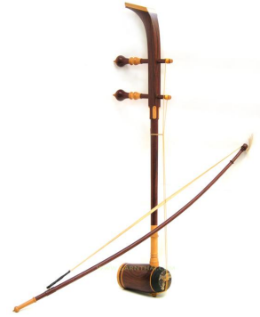
ภาพประกอบ : เครื่องดนตรีไทยปี่นอก ซออู้ และซอด้วง

ความสำคัญของดนตรีพื้นบ้านภาคใต้ ดนตรีพื้นบ้านภาคใต้ได้รับใช้สังคมของชาวใต้ พอสรุปได้ดังนี้