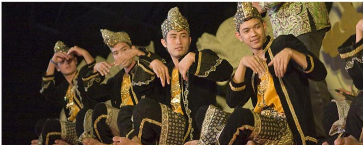
ภาพประกอบ : ตัวอย่างการแสดงดิเกฮูลู

ลิเกฮูลู หรือ ดิเกฮูลู เป็นการละเล่นพื้นบ้านของชาวมลายูมุสลิมภาคใต้ของไทย ขึ้นบทเป็นเพลงประกอบดนตรีและจังหวะตบมือมีผู้ให้ท่าที่มาของดิเกฮูลูเอาไว้หลายสำนวน ในที่นี้จะขอหยิบยกออกมา 2 สำนวนกล่าวคือหนึ่ง ตามสำนวนที่รับรู้กันโดยทั่วไป มีผู้รู้บางท่านได้ศึกษาไว้ว่าดิเก (Dikir) มีรากศัพท์มาจากคำว่าซี เกร์ ซึ่งเป็นภาษาอาหรับ หมายถึงการอ่านทำนองเสนาะ ส่วนคำว่าฮูลู แปลว่าได้หรือทศได้ รวมความแล้วหมายถึงการขับบทกลอนเป็นทำนองเสนาะจากทางใต้