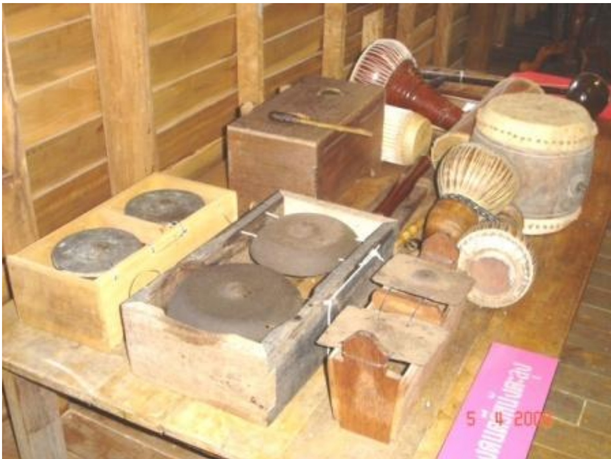
ภาพประกอบ : ตัวอย่างเครื่องดนตรีประกอบคณะหนังตะลุง

กลองโนรา ใช้ประกอบการแสดงโนราหรือหนัง ตะลุง โดยทั่วไปมีขนาดเส้นผ่าศูนย์กลางของหน้า กลองทั้ง ๒ ด้าน ประมาณ ๑๐ นิ้ว และมี ส่วนสูงประมาณ ๑๒ นิ้ว กลองโนรานิยมทำด้วยแก่น ไม้ขนุน เพราะเชื่อว่าทำให้เสียงดี หนังที่ หุ้มกลองใช้หนังวัวหรือควายหนุ่ม ถ้าจะให้ ดีต้องใช้หนังของลูกวัวหรือลูกควาย มี หมุดไม้หรือ ภาษาใต้เรียกว่า "ลูกสีก" ตอกยึดหนังหุ้มให้ตึง มีขาทั้งสอง ขาทำด้วยไม้ไผ่มีเชือกตรึงให้ติดกับ กลอง และมี ไม้ตีขนาดพอเหมาะ ๑ คู่ ถ้า เป็นกลองที่ใช้