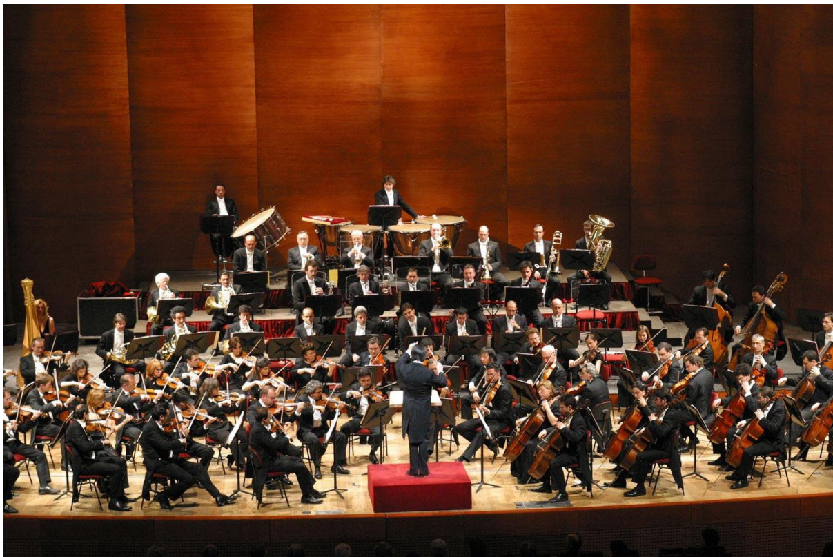
ภาพประกอบ : ตัวอย่างวงดนตรีคลาสสิก

สำหรับในวัฒนธรรมอื่นๆดนตรีประเภทนี้รวมถึง ดนตรีประจำชาติ ที่เรียกว่า Traditional Music ซึ่งเป็นดนตรีที่ประพันธ์ขึ้นอย่างมีระเบียบแบบแผนเช่นกัน โดยแสดงถึงอารยธรรมและเอกลักษณ์ของแต่ละเชื้อชาติ อาจเป็นดนตรีที่ใช้บรรเลงในราชสำนักหรือดนตรีที่ใช้บรรเลงเพื่อการฟังเช่น ดนตรีทางากูในราชสำนักของญี่ปุ่น ดนตรีฮินดูสถานและดนตรีกานาดักของอินเดีย ดนตรีกาเมลันของอินโดนีเซีย ดนตรีไทยเดิมของไทย เป็นต้น