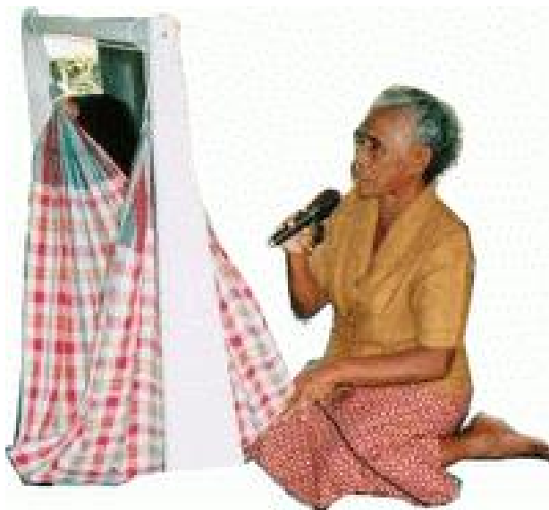
ภาพประกอบ : ตัวอย่างการแสดงโชว์การร้องเพลงกล่อมเด็ก

“...ไก่เถื่อนเหอ... ชั้นเทือนทั้งบ้าน ลูกสาวซี้คร้าน... นอนให้แม่ปลุก แม่เอาด้ามขวาน... แหวงวานดังพลุบ นอนให้แม่ปลุก... ลูกสาวซี้คร้านเหอ...”