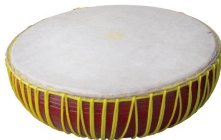
ภาพประกอบ : เครื่องดนตรีรำมะนา

ในระยะต่อมาหลังจากมีการติดต่อ การค้าขายกับอินเดียและจีน การถ่ายโยงวัฒนธรรมย่อมเกิดขึ้น สังเกตได้อย่างชัดเจนจาก ทับ (กลอง) ที่ใช้ประกอบการเล่นโนรา มีร่องรอยอิทธิพลของอินเดียอย่างชัดเจน และการมีอาณาเขตติดต่อกับชวา - มลายู ภาษาและวัฒนธรรมทางดนตรี จึงถูกถ่ายโยงกันมาด้วย เช่น แลป จังหวัดภาคใต้ที่ติดเขตแดน อาจกล่าวได้ว่าดนตรีพื้นบ้าน ของภาคใต้มีอิทธิพลแบบชวา มลายูก็ยังไม่ผิด เช่น รำมะนา (กลองหน้าเดียว)