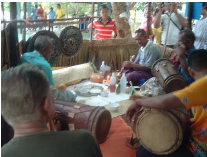
ภาพประกอบ : ตัวอย่างการเล่นดนตรีกาหลอ และพิธีกรรมในงาน