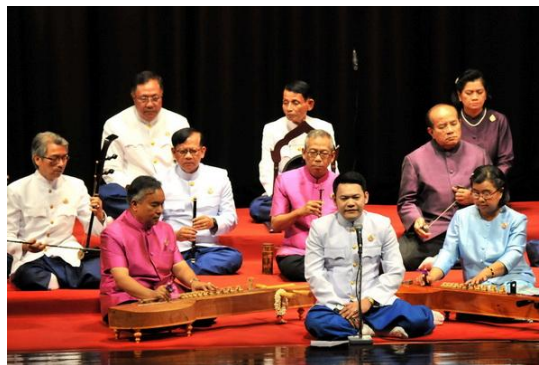
ภาพประกอบ : ตัวอย่างวงดนตรีไทยสำหรับขับร้อง

2. เพลงสำหรับขับร้อง คือ เพลงซึ่งร้องแล้วรับด้วยการบรรเลง เรียกว่า ร้องส่งดนตรี เช่น เพลงประกอบ การขับเสภา(ร้องส่งเสภา) เพลงที่ร้องส่งเพื่อฟังไพเราะทั่วไปส่วนมากจะเป็นเพลงเถาและเพลงตับ