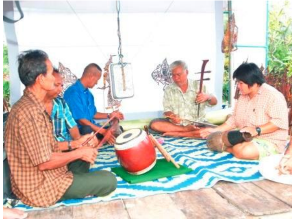
ภาพประกอบ : ตัวอย่างการวงดนตรีประกอบคณะหนังตะลุง

เครื่องดนตรีหนังตะลุงในอดีต มีความเรียบง่าย ชาวบ้านในท้องถิ่นประดิษฐ์ขึ้นได้เอง มี ทับ กลอง โหม่ง ฉิ่ง เป็นสำคัญ ส่วน ปี่ ซอ นั้นเกิดขึ้นภายหลังจนเมื่อมีวัฒนธรรมภายนอกเข้ามา โดยเฉพาะดนตรีไทยสากล หนังตะลุงบางคนจะจึงนำเครื่องดนตรีใหม่ ๆ เข้ามาเสริม เช่น กลองชุด กีตาร์ ไวโอลิน ออร์แกน