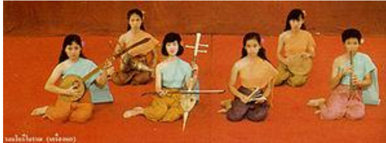
ภาพประกอบ : ตัวอย่างวงดนตรีไทยสำหรับการบรรเลงล้วนๆ

1. เพลงสำหรับบรรเลงดนตรีล้วนๆ ไม่มีการขับร้อง เป็นเพลงที่ใช้บรรเลงประโคมพิธีต่างๆ เพลงโหมโรง และ เพลงหน้าพาทย์ จะเป็นเพลงสำหรับใช้ประกอบกิริยาอาการและแสดงอารมณ์ต่างๆ ของการรำ