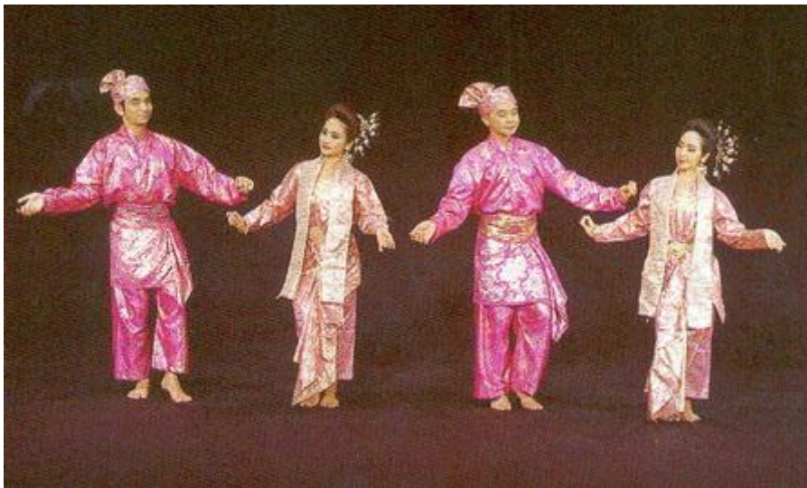
ภาพประกอบ : ตัวอย่างการแสดงรองเง็ง

ยุคแรกการแสดงรองเง็งยังอยู่ในวงจำกัด ใช้ผู้หญิงเข้าทาสบรivarฝึกหัดกัน เนื่องจากวัฒนธรรมมุสลิมไม่นิยมให้สตรีเข้าสังคมใกล้ชิดกับบุรุษอย่างประเจิดประเจ้อ ต่อมาจึงใช้รองเง็งเป็นการแสดงสลับฉากฆ่าเวลาขณะเมื่อการแสดงละครมะโย่งหยุดพักครั้งละ ๑๐-๑๕ นาที เพื่อให้เกิดความสนุกสนานเชิญให้ผู้ชมลุกขึ้นมาร่วมวงด้วย ในที่สุดรองเง็งจึงได้พัฒนารูปแบบจนเป็นที่ถูกใจชาวบ้าน มีการตั้งคณะรองเง็งขึ้นรับจ้างไปแสดงตามงานต่างๆ ทำนองคณะรำวงรับจ้างของไทย