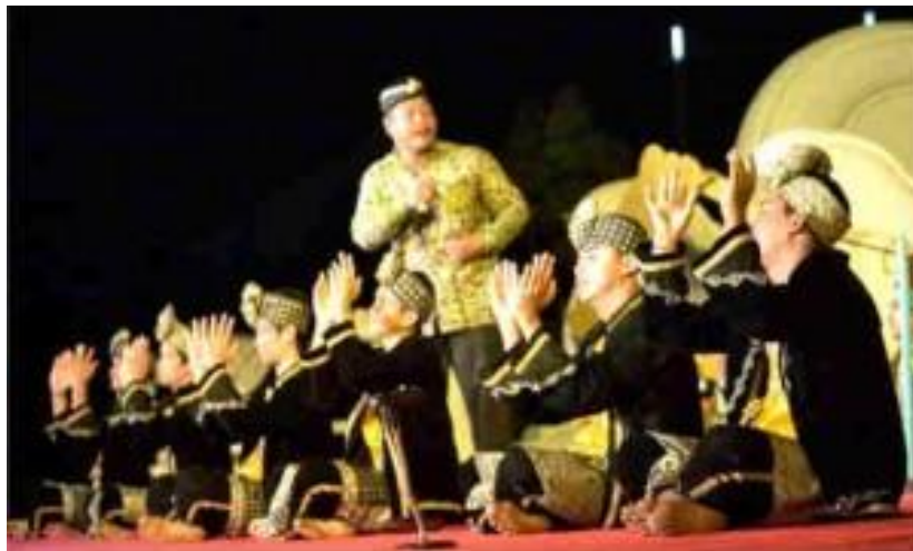
ภาพประกอบ : ตัวอย่างการแสดงดิเกฮูลู

เครื่องดนตรีประกอบ เล่นลิเกฮูลู ประกอบด้วยรำมะนา อย่างน้อย ๒ ใบ ใช้ตีดำเนินจังหวะในการแสดง ฆ้อง เป็นเครื่องกำกับจังหวะ ตีสม่ำเสมอประกอบการร้อง นอกจากนี้ยังมีเครื่องดนตรีที่ใช้ประกอบและเป็นที่ยอมรับกันว่า ทำให้ครึกครื้น สนุกสนานไพเราะมากยิ่งขึ้น เช่น ขลุ่ย ลูกแซก แต่จังหวะที่ใช้เป็นประเพณีในการเล่นคือ การตบมือ