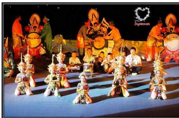
ภาพประกอบ : ตัวอย่างวงดนตรีประกอบการแสดงมโนราห์

3. เพลงประกอบการรำ คือ เพลงร้องตามบทร้อง ให้ผู้รำได้รำตามบทหรือเนื้อร้อง ส่วนมากจะเป็นเพลง สองชั้น เพื่อให้เหมาะกับการรำไม่เข้าไปไม่เร็วไป นอกจากนั้นก็ยังใช้เพลงหน้าพาทย์ประกอบการแสดง กิริยาอาการของผู้แสดงอีกด้วย