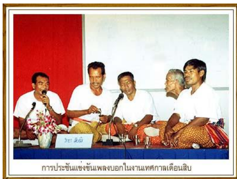
ภาพประกอบ : ตัวอย่างการร้องเพลงบอกแข่งขันในเทศกาลเดือนสิบ

3. เพลงบอกประชัน เป็นการโต้เพลงบอกให้ผู้ชมฟัง โดยการจัดเวที เพื่อประชันโต้ตอบ ไม่มีการกำหนดหัวข้อและเวลา แล้วแต่ใครจะหยิบยกเรื่องอะไรมาว่า แต่ส่วนใหญ่จะเป็นการเปรียบเทียบ และต้องว่าในทำนองข่มกัน หาทางโจมตีและกล่าวแก้ได้ทันควัน การตัดสินแพ้ชนะใช้เสียงผู้ชมเป็นหลักโดยฟังจากเสียงโห่หรือโด้กันจนอีกฝ่ายหนึ่งยอมแพ้